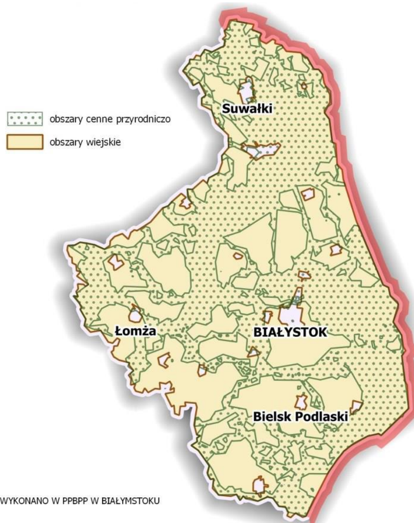
Rysunek 2. Obszary wiejskie w województwie podlaskim, w tym przyrodniczo cenne